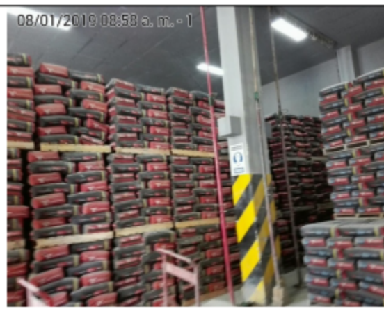
FOTOGRAFÍA 4. ALMACENAMIENTO DE CEMENTO